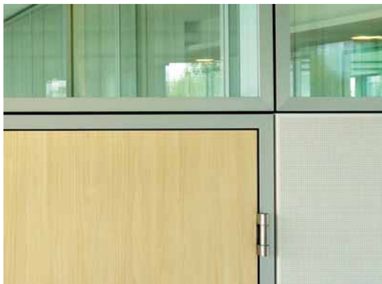
Voll kombinierbar mit dem Planus Trennwandsystem

Darüber hinaus können Türelemente, Vollwände und Glaselemente in allen Schallausführungen kombiniert werden. Der Einbau von hochschalldämmenden Türelementen wie z. B. Alurahmen- oder Holztüren ist genauso möglich wie die Integration von Voll- oder Glaselementen. Damit zeigt sich Pur duo als High-End-Lösung im Bereich der transparenten Trennwandsysteme.