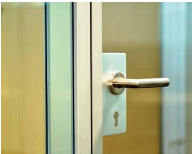
Der Einbau von hochschalldämmenden Türelementen in unterschiedlichsten Ausführungen ist möglich