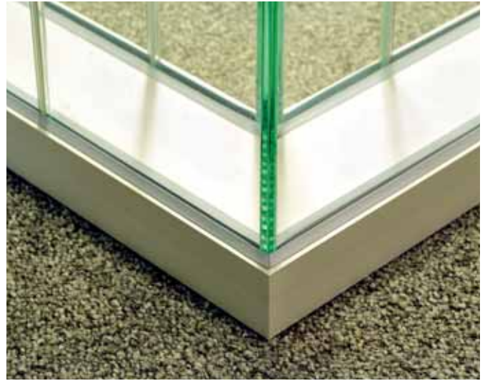
Verwendung von 10 und 12 mm starken Glasscheiben möglich