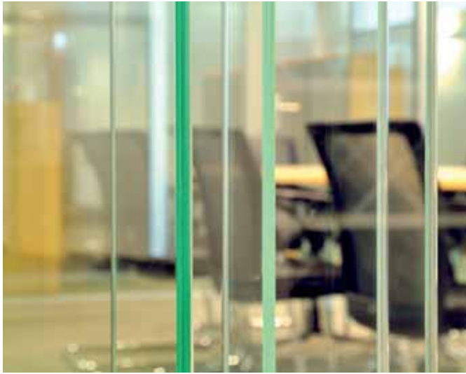
Glasscheiben werden durch transparente Spezialdichtungskeder stumpf gestoßen