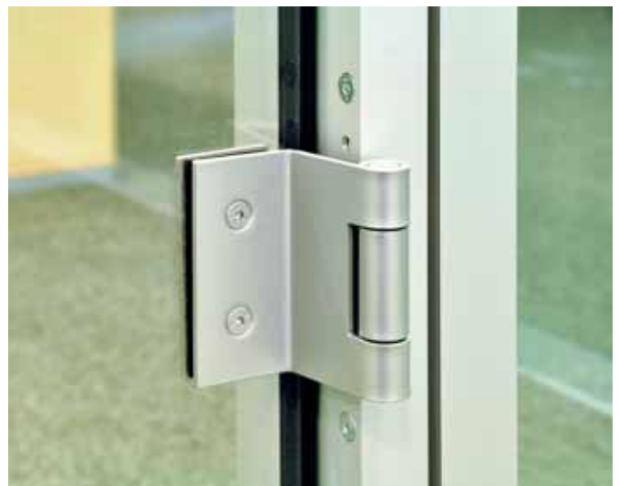
Durch schlanke Profilansichten von nur 40 mm besitzt das System eine höchstmögliche Transparenz