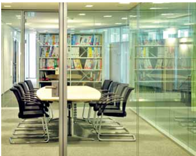
Maximaler Schallschutz von bis zu 47 dB